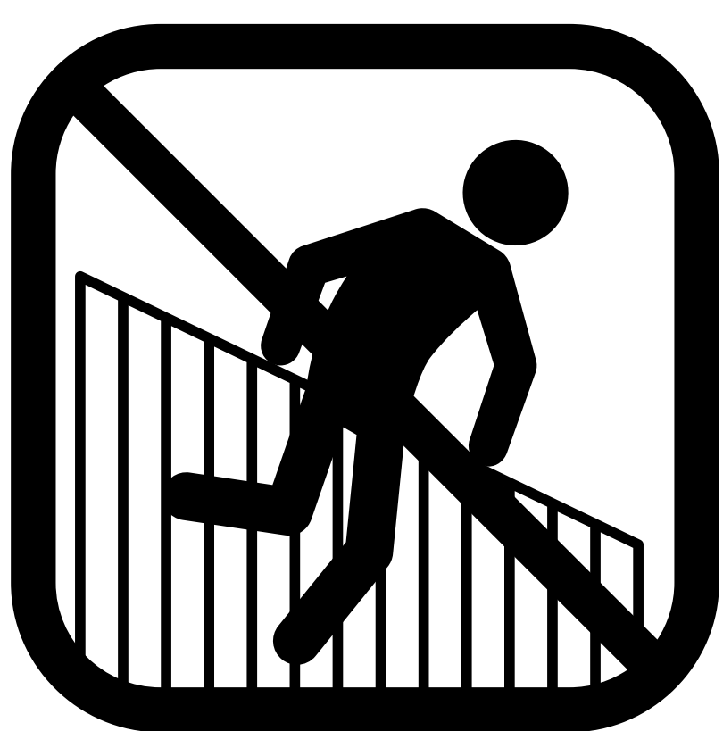
Forcering af hegn

Betaling af ovennævnte afgifter udelukker ikke anvendelse af øvrige sanktioner, erstatningsansvar og retsforfølgelse.